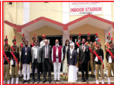
Peer Team with the NCC Cadets