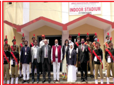
Peer Team with the NCC Cadets